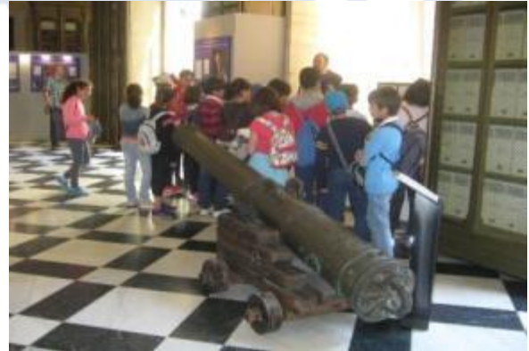
Visita al Archivo de Indias