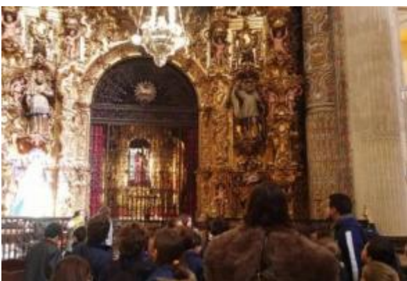
Ayuntamiento e Iglesia del Salvador