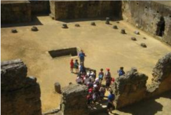
Necrópolis y centro arqueológico de Carmona