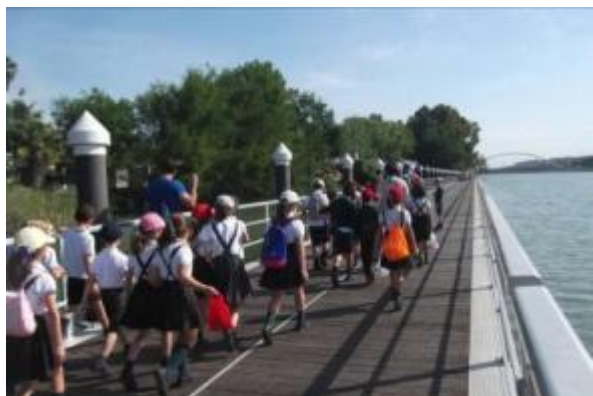
Recorrido interpretativo a pie por el río Guadalquivir