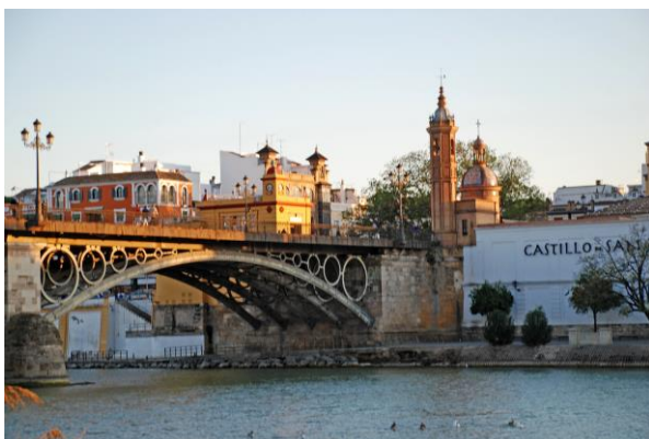
Historias y leyendas de Triana