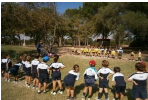
Gymkhanas de juegos cooperativos y deportivos